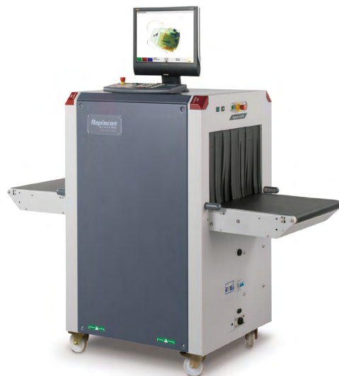
OUVERTURE DU TUNNEL (LXH): 550 X 360 MM (21,7 X 14,2 IN)

LE RAPISCAN 618XR EST UN SYSTÈME D'INSPECTION À RAYONS X COMPACT ET POLYVALENT, DOTÉ D'UNE QUALITÉ D'IMAGE EXCEPTIONNELLE ET D'EXCELLENTE CAPACITÉ DE DÉTECTION.