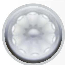
Tête de division 1:10