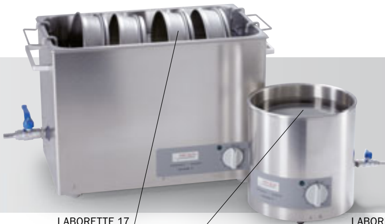
LABORETTE 17 Taille II