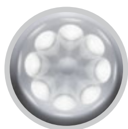
Tête de division 1:8