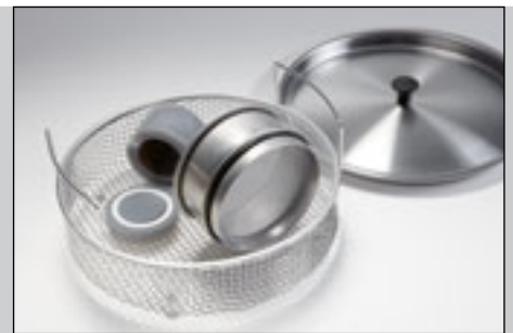
LABORETTE 17 Taille I

Travail aisé Pour le nettoyage, les tamis sont tout simplement posés ou immergés dans le liquide de nettoyage.